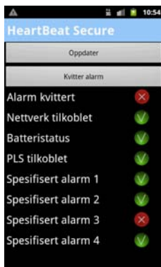
Statusbilde på telefonen