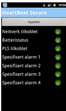
Statusbilde på telefonen

Det unike med denne løsningen er at brukeren får varsel om forbindelsen blir brutt.